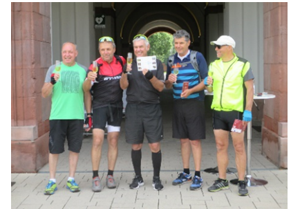
Visiteurs cyclistes avec le pass- passeport le 10.07.2021 à Gernersheim

Wanderausstellung im Four à Chaux in Lembach