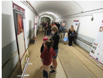
Exposition itinérante au Four à Chaux à Lembach

Screenshot während der Livestream- Pressekonferenz am 15. April 2021